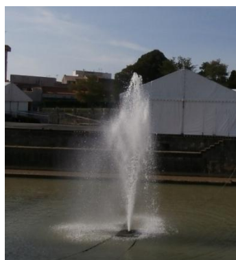
Fontaine de régénération d'eau (radoub) en service à Rochefort